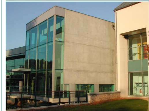
L'architecture contemporaine utilise les propriétés esthétiques du béton et de ses différentes finitions.

Un badigeon est constitué de chaux pure et d'eau (lait de chaux) teinté par des colorants naturels (terres, ocres). Il peut présenter des caractéristiques bactéricides et fongicides.