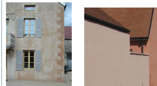
En restauration ou en neuf, la finition et la couleur de l'enduit jouent un rôle primordial.